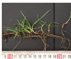
Ray-grass anglais traçant