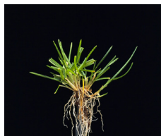
Pâturin des prés