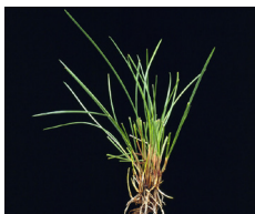
Fétuque rouge traçante