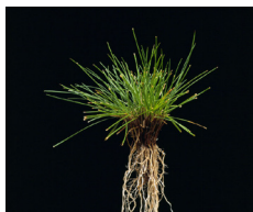
Fétuque rouge gazonnante