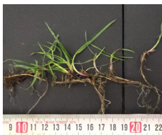
Ray-grass anglais traçant